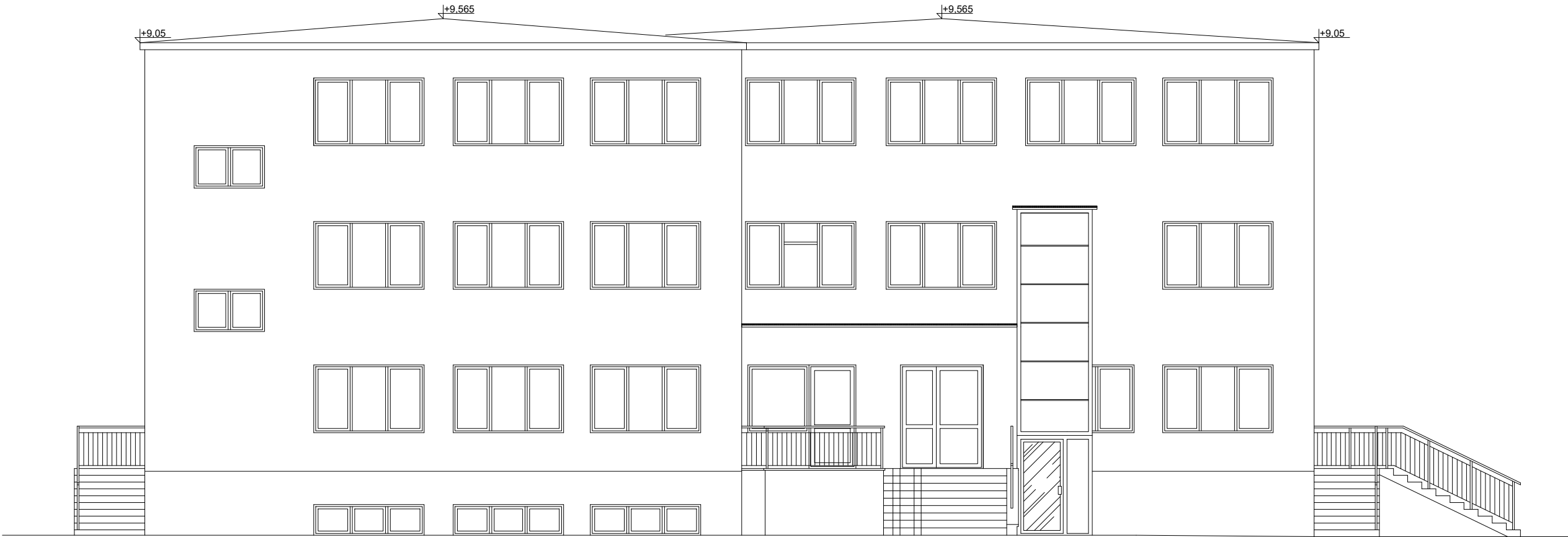
Elewacja frontowa - wschodnia