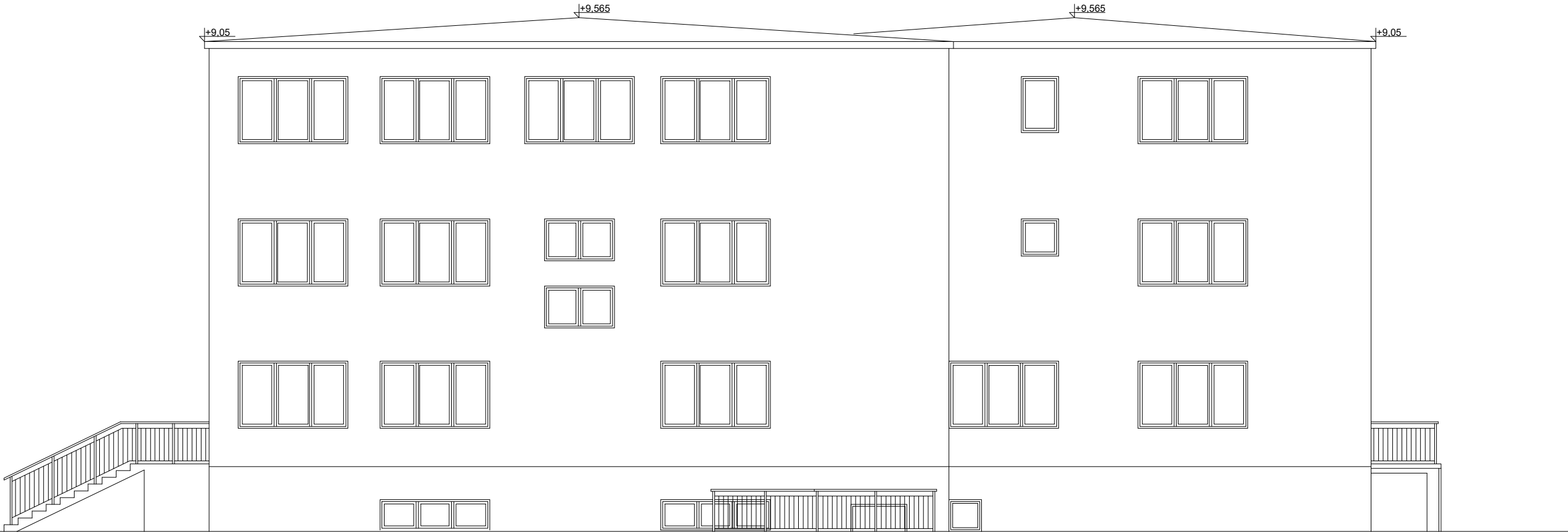
Elewacja tylna - zachodnia